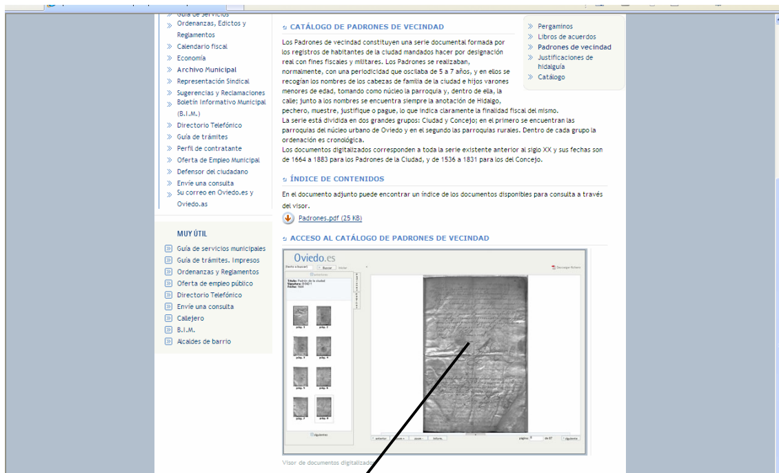
Visor de documentos

Para comenzar la búsqueda en los Padrones, haremos clic con el ratón sobre el visor de documentos: