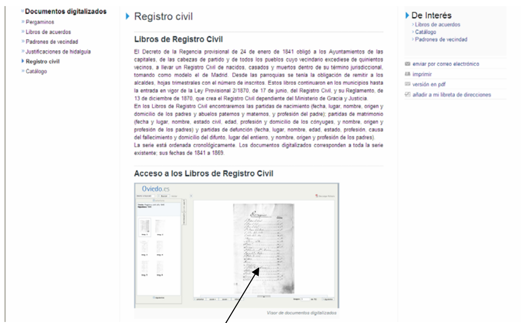
Visor de documentos

Para comenzar la búsqueda en los Libros de Registro Civil, haremos clic con el ratón sobre el visor de documentos: